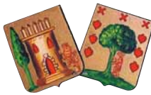
Mª Jesus Menika Gamiz-Fikako alkatea